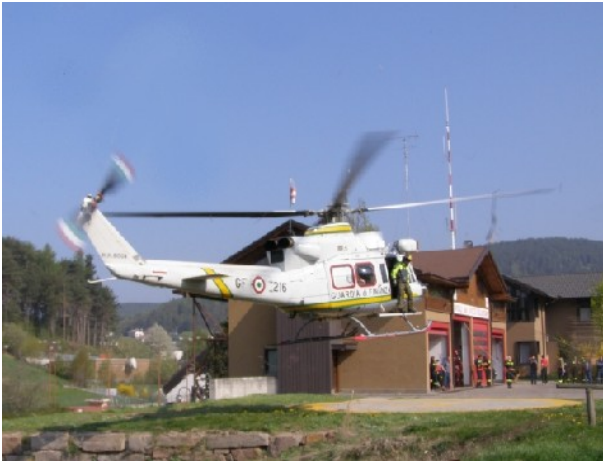
Fig. 2 - Manovra “Grigne Ceramonte”

collaborazione fra corpi diversi, il corpo di Baselga ha curato una manovra interforze denominata “Grigne Ceramont”, che ha visto impegnato su vari fronti tutti i corpi dei vigili del fuoco del circondario, oltre alla croce rossa, al soccorso alpino, alle forze dell’ordine e alla sezione aerea